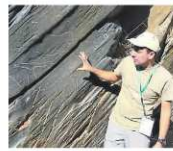
Bei Siega Verde wurden steinzeitliche Felszeichnungen gefunden.