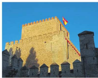
Die Burg in Ciudad Rodrigo war 1932 eine der ersten Burgen, die in einen Parador umgewandelt wurden.

Zunächst einmal beginnt in Gredos jedoch die Geschichte der Paradores. Denn was nutzen die schönsten Landschaften und zauberhaftesten Städtchen, wenn zig Kilometer im Umkreis kein anständiges Hotel zu finden ist? Dachte sich vor fast 100 Jahren der Königliche Kommissar für Tourismus, Marqués Benigno de la Vega Inclán, und legte Alfons XIII. ei-