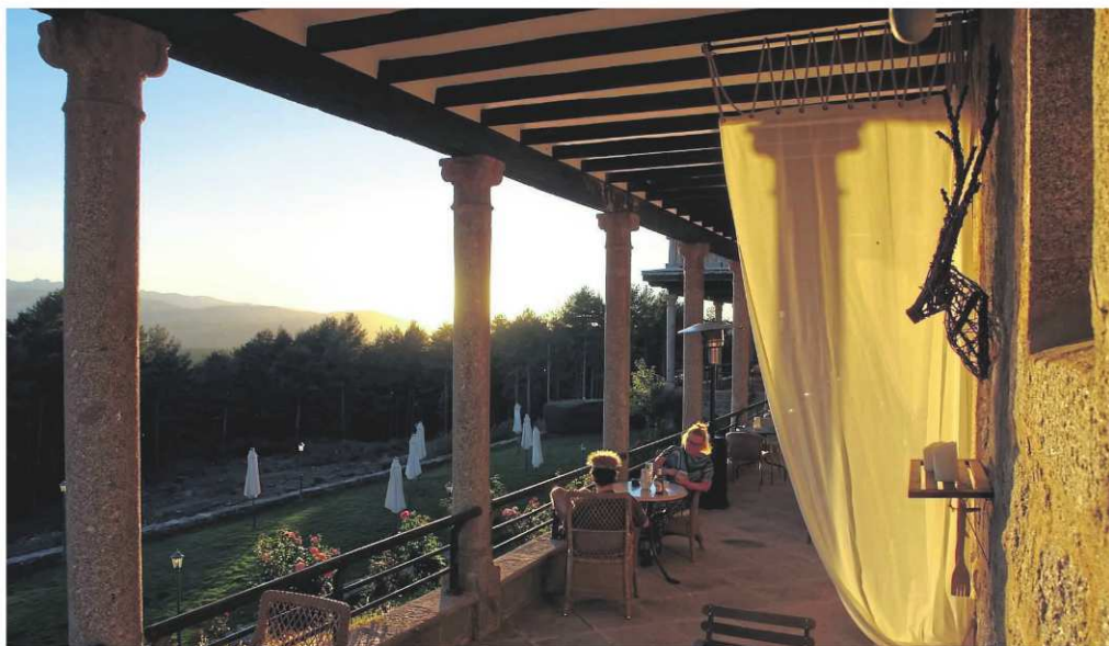
Gäste im Parador de Gredos suchen Ruhe. Sie finden diese bei einem Wein auf der Terrasse, wenn die Sonne die Berge vergoldet.

Jäger erfreuen sich im Allgemeinen keines besonders guten Images. Dafür mitverantwortlich sind Großwildjäger, die aus purer Lust am Töten auf Safaris gehen und der Trophäe wegen schießen. Wer Geld genug hat, wird sogar auf seltene Arten losgelassen. Und weil sie bei der breiten Masse eher schlecht angesehen sind, erscheint es fast schon mutig von einem solchen Jäger, vor Gericht zu gehen – weil es ihm in Weißrussland nämlich nicht gelungen war, bei einer Reise einen Elch abzuschließen. Er verklagte deshalb den Veranstalter auf Schadenersatz. Weil kein Elch aufgetaucht war? Mitnichten. Der Veranstalter erklärte, der Kunde habe seine Abschusschance sehr wohl erhalten, und bekam vom Amtsgericht Mönchengladbach Recht. Der Mächtegen-Elchkiller hatte schlichtweg nicht getroffen. Weil er sich mit seiner Klage aber Öffentlichkeit geschaffen hat, dürfte es den Jäger nun selbst treffen: mit Spott und Häme der Jagd-Gegner.