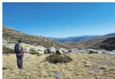
Die Sierra de Gredos nordwestlich von Madrid gehört zu den einsamen Gegenden Europas.

Aus dem kühnen Plan des Königlichen Tourismuskommissars Don Benigno ist eine Erfolgsgeschichte geworden, die alle politischen Umbrüche überdauerte. In Spanien gibt es mittlerweile 98 Paradores – viele in ehemaligen Palästen, Burgen und Klöstern, manche mit spektakulären